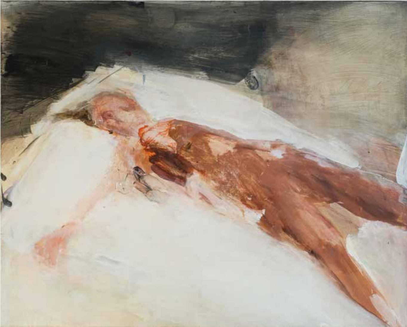
80 x 100 cm