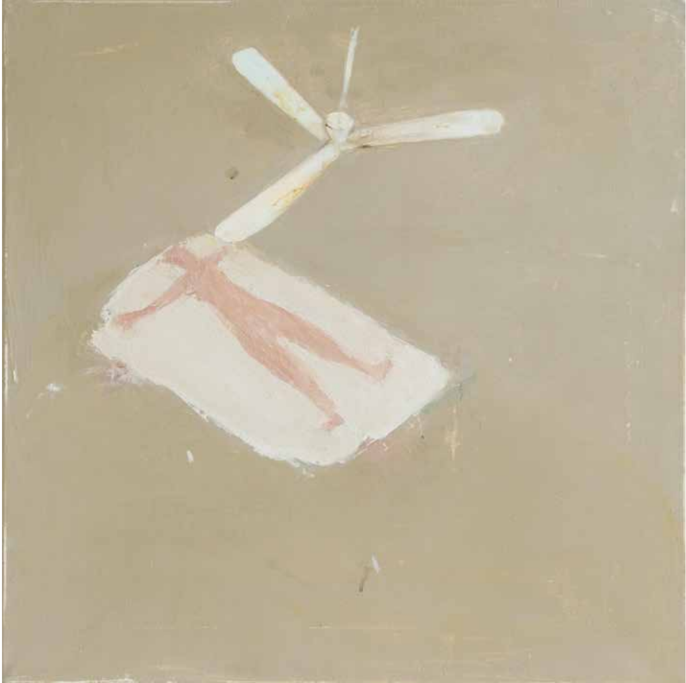
70 x 70 cm