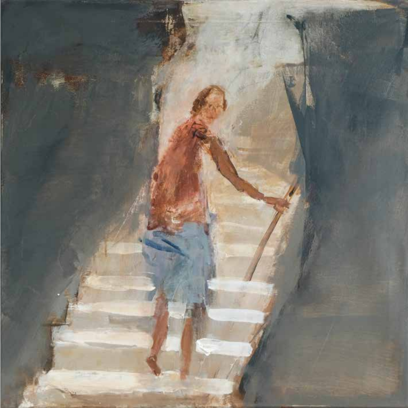
70 x 70 cm