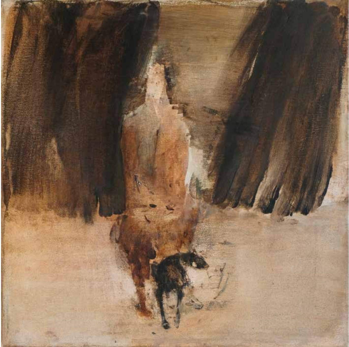
40 x 40 cm