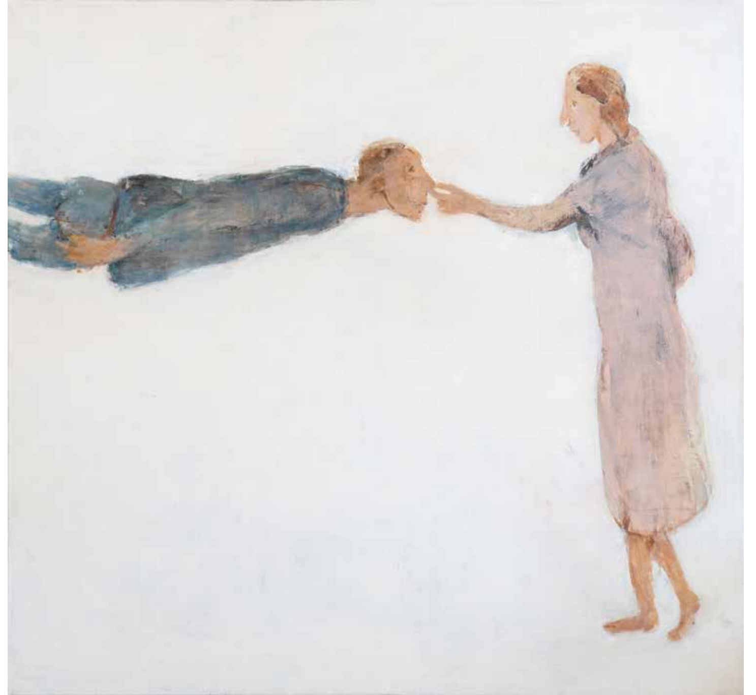
160 x 150 cm