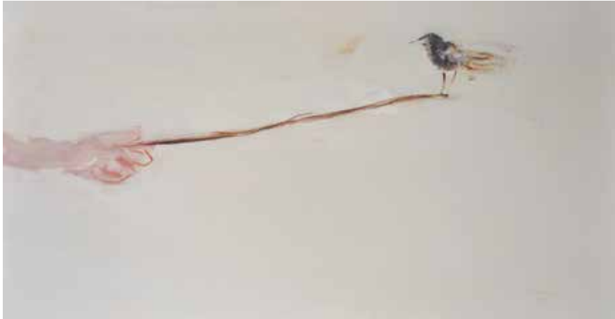
50 x 95 cm