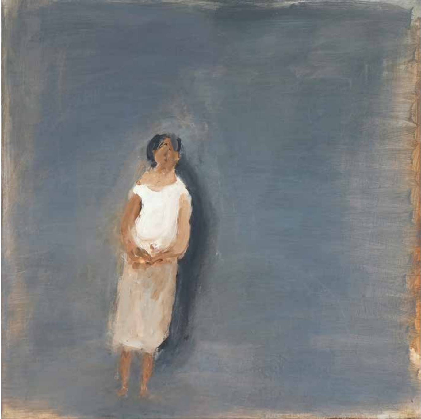
70 x 70 cm