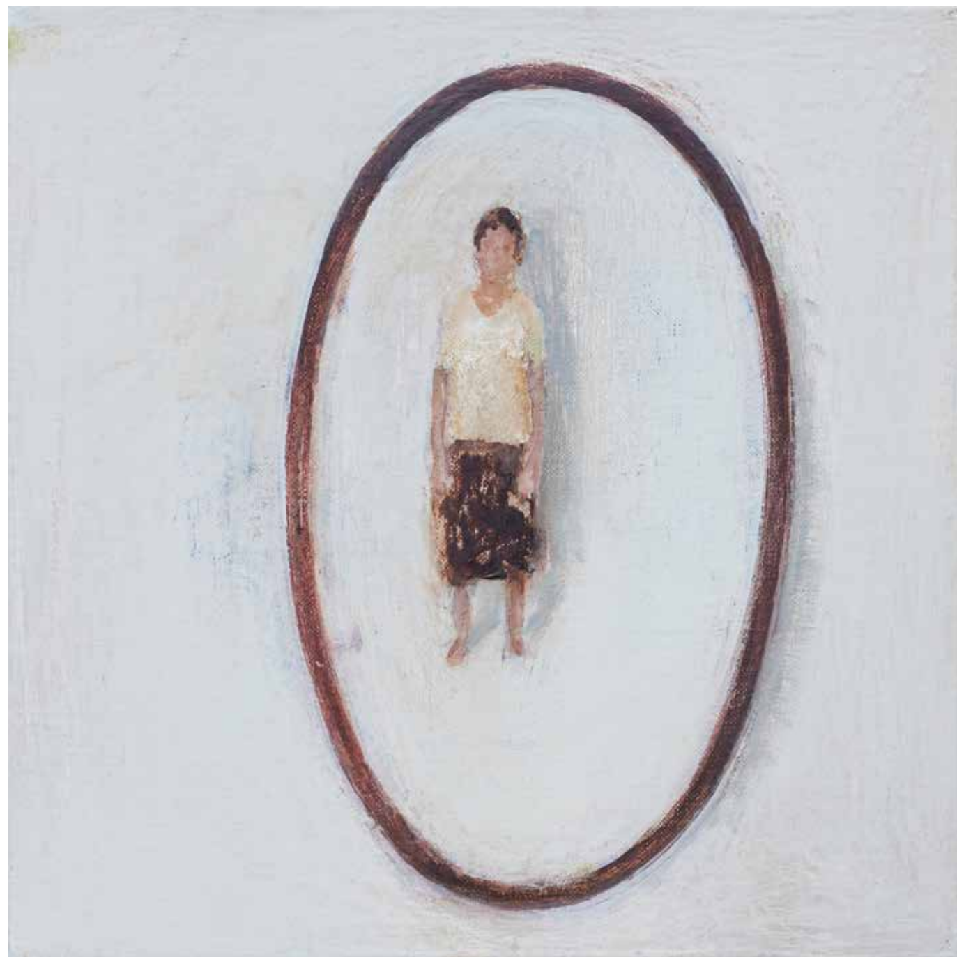
40 x 40 cm