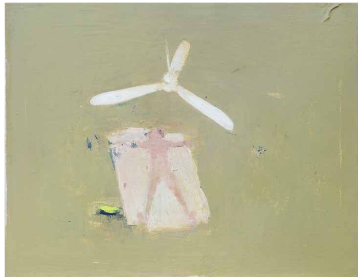
50 x 65 cm