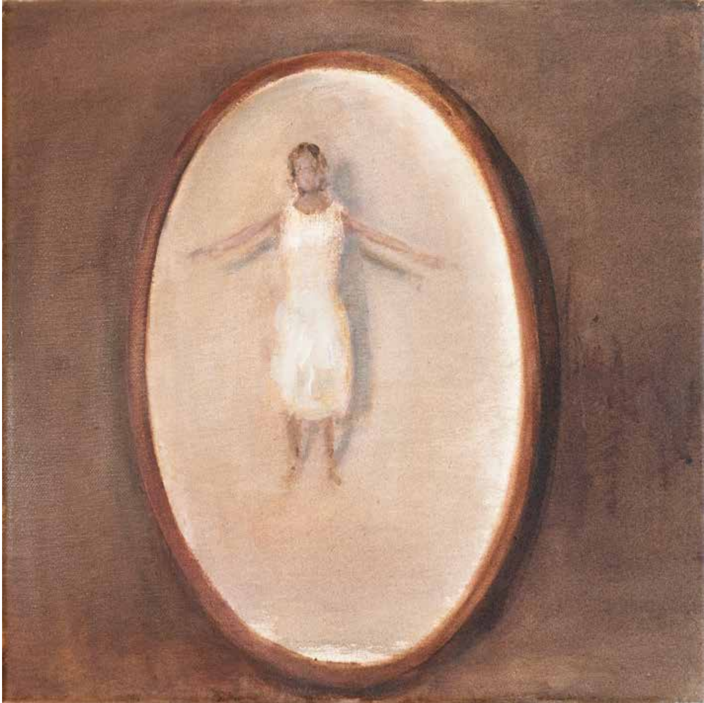
40 x 40 cm