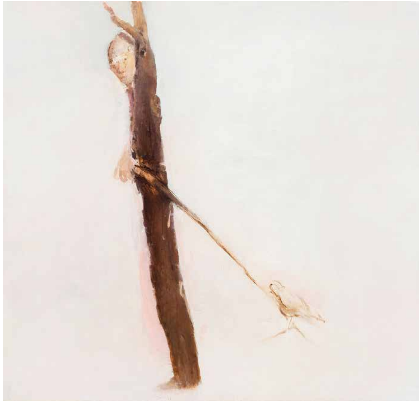
150 x 160 cm

Nasser Hussein paints in earthy yellows and browns and slightly cooler grays. Shades of almond, ecru, bistre, beaver, chocolate, russet, rust, sand, liver, taupe, walnut, and slate gray, with occasional dashes of citron produce a warmth in tone which belies the detachment in subject matter.