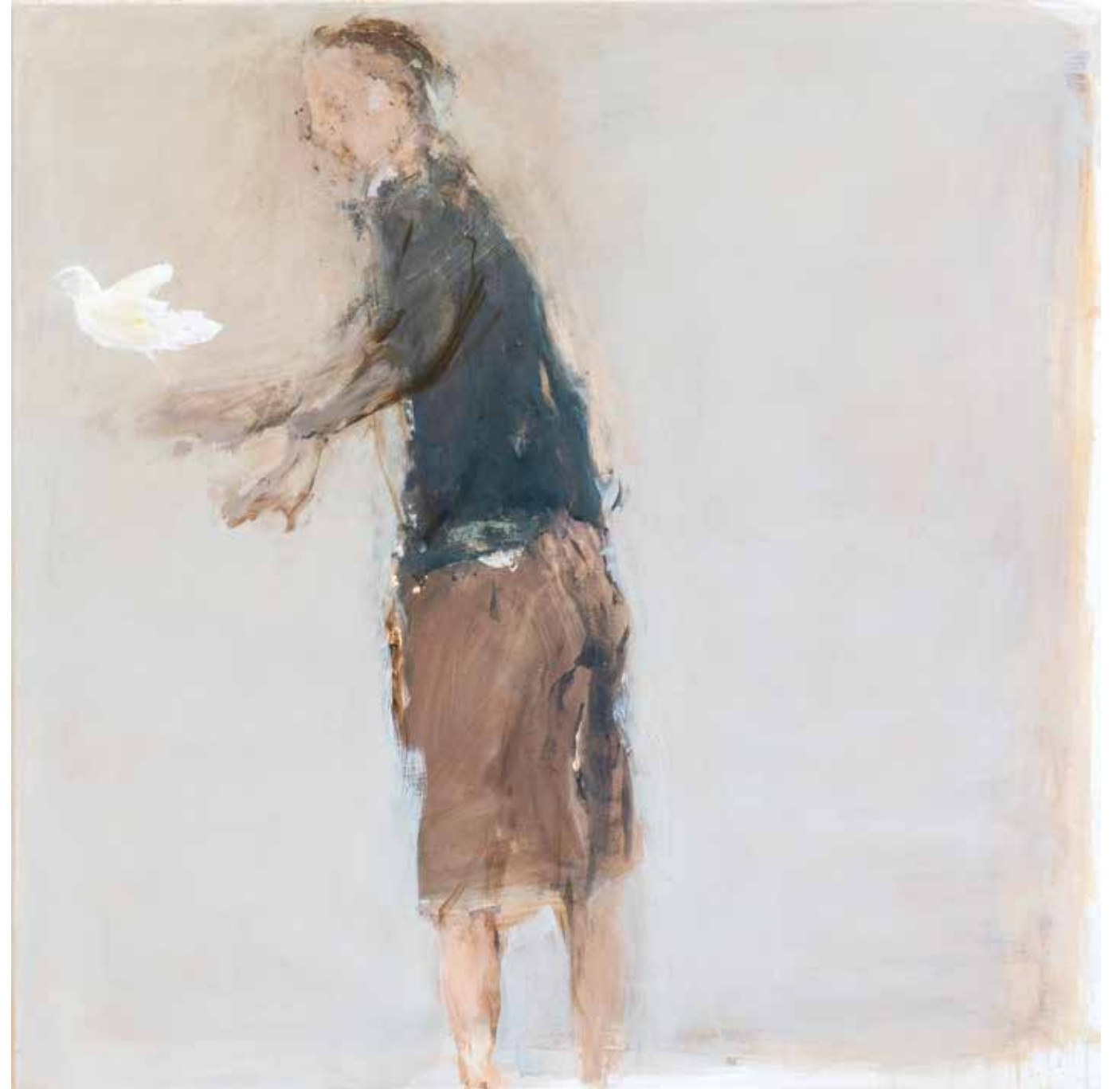
120 x 120 cm