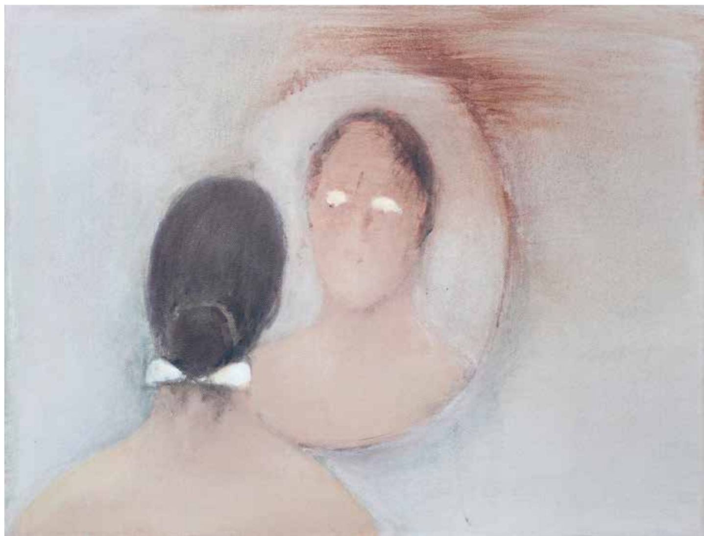
50 x 65 cm