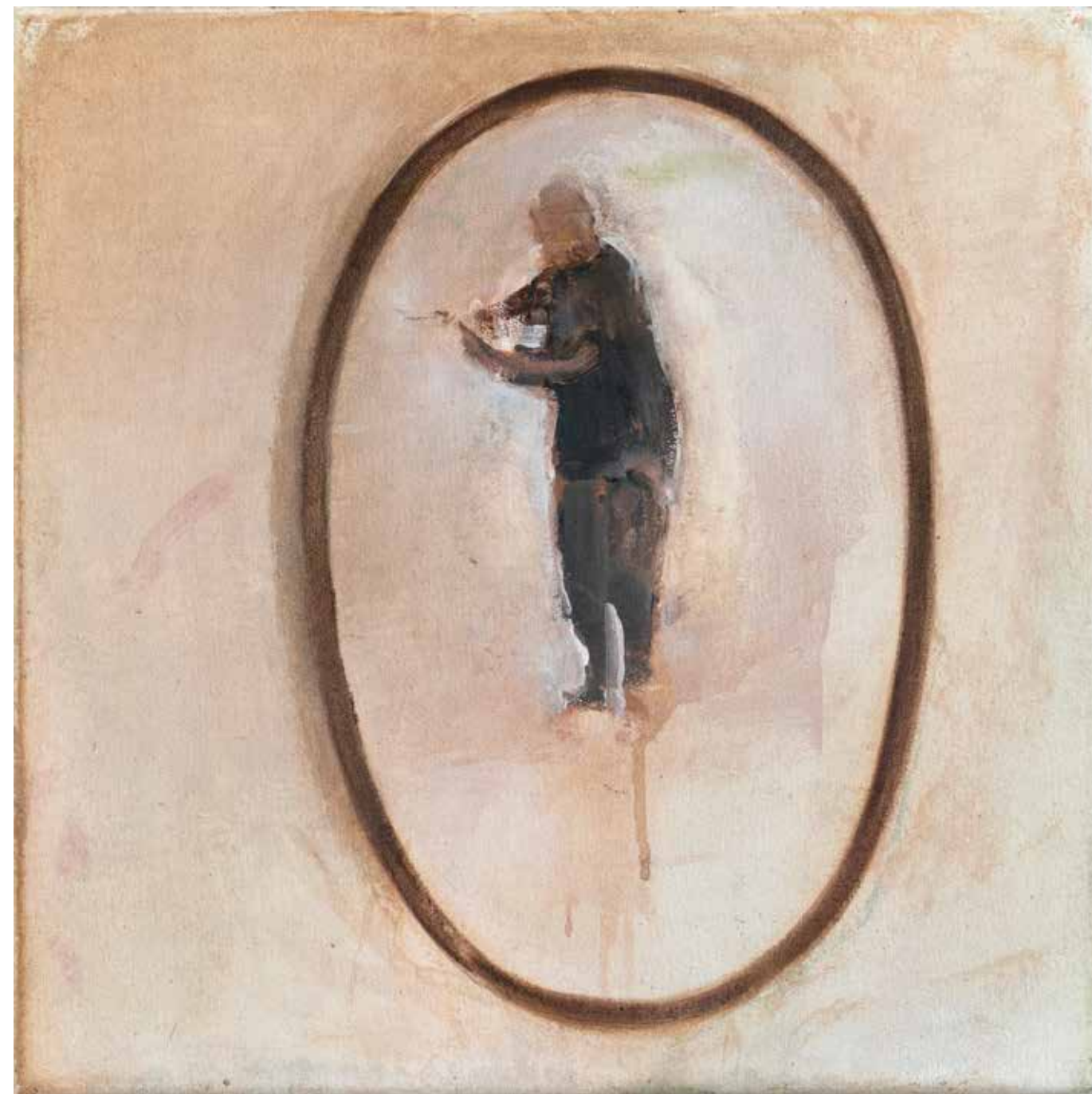
40 x 40 cm