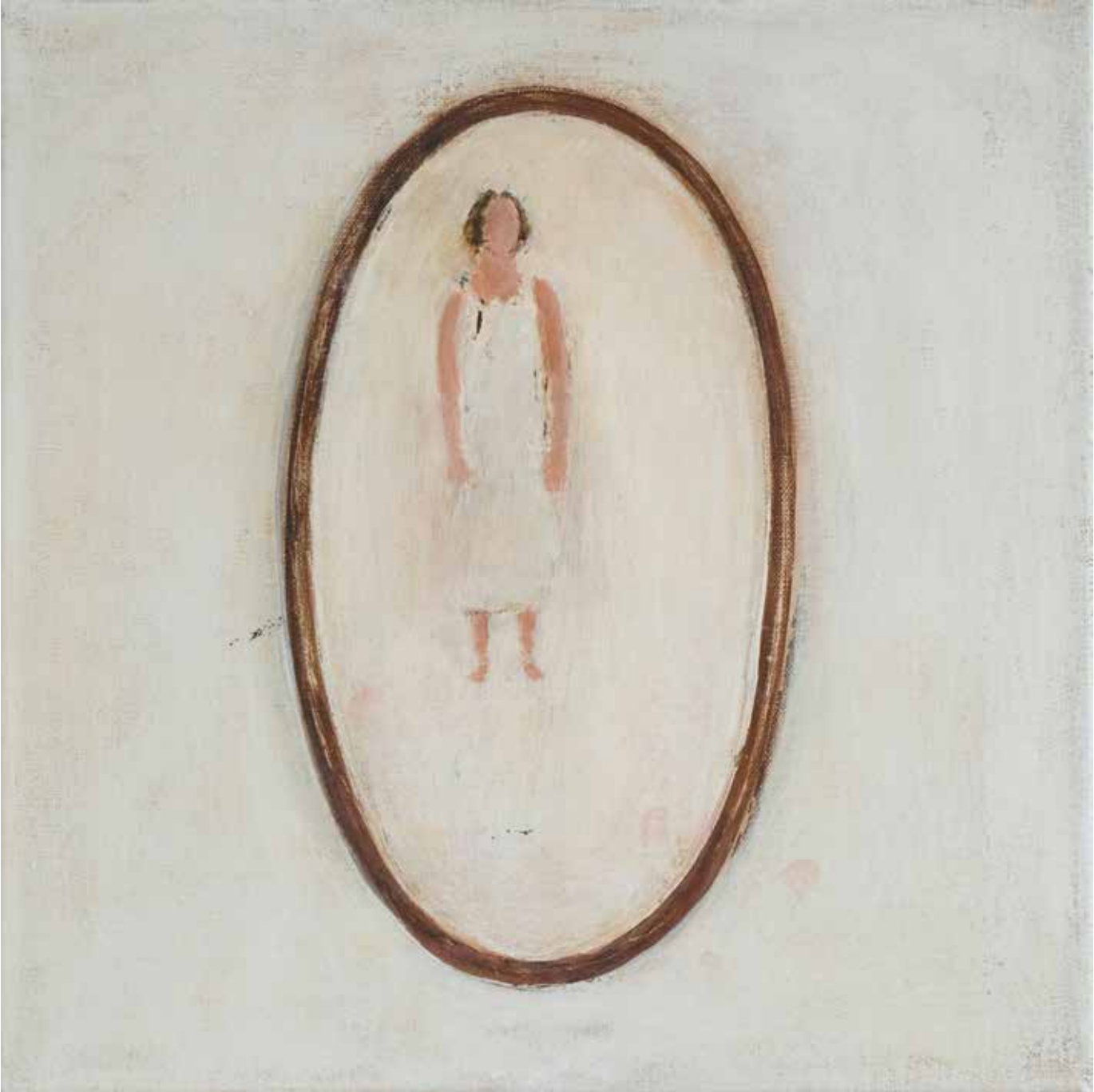
40 x 40 cm